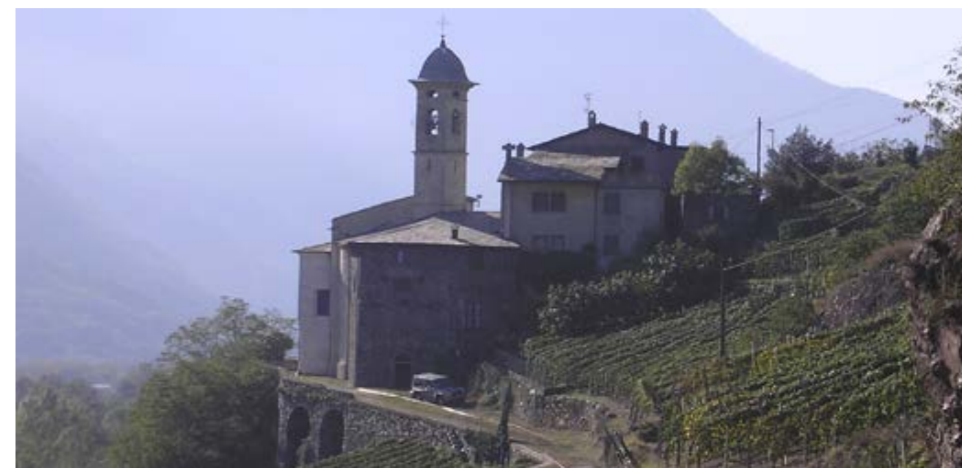
Vinogradi pri Sondriu, alpskem mestu leta 2007: varstvo tradicionalnih suhih zidov

Priznanje mednarodne skupnosti, kar pomeni naziv, ima izrazito pozitivno konotacijo in sporoča, da se mesto dejansko loteva reševanja okoljske problematike in izzivov, ki jih prinaša trajnostni razvoj. Naziv je zato mogoče tako znotraj mreže kakor tudi zunaj nje izkoristiti pri trženju alpskega mesta leta kot tržne znamke. Idrija, denimo, podeljeni naziv pogosto uporablja pri utemeljevanju predlogov za izvedbo novih trajnostnih projektov.