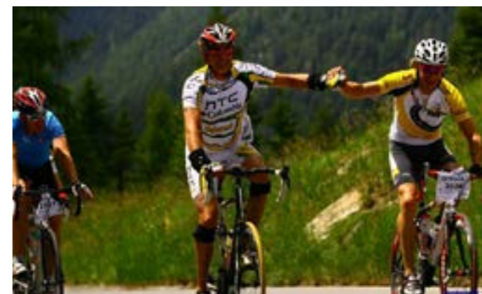
Srečanje alpskih mest druge vrste