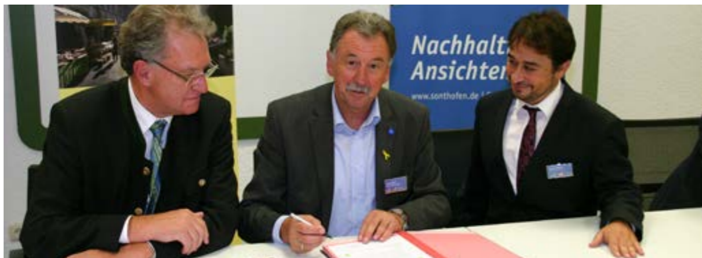
Fotografija: mesto Sonthofen

Konvencija županov je v nekaterih alpskih mestih že postala sestavni del politike: Annecy, Bolzano in Chambéry so člani te pobude že nekaj let in so tudi pripravili akcijske načrte za trajnostno oskrbo z energijo, ki vodijo v doseganje ciljev energetske-podnebnega svežnja 20-20-20 do leta 2020. Sonthofen in Idrija sta leta 2012 podpisala Konvencijo županov in v prvem koraku izdelala pregledno shemo o tem, kje in kolikšne količine izpustov CO 2 načrtujeta. Pred kratkim pa so tudi iz Bad Reichenhalla sporočili, da se nameravajo pridružiti omenjenim petim alpskim mestom.