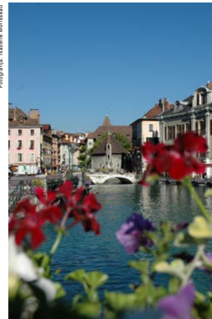
Annecy se je v letu, v katerem je bil nosilec naziva «Alpsko mesto leta», posvetil vodi in podnebnim spremembam.

za trajnostni razvoj, seveda pa tudi priložnost za komuniciranje z meščani in meščankami.