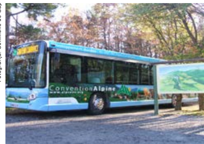
V Gapu se vozi brezplačni bus z logotipom Alpske konvencije.