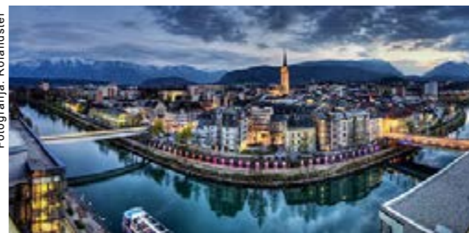
Namen nove aplikacije za mobilni telefon je spodbuditi prebivalce Beljaka k varčnemu ravnanju z vodo.