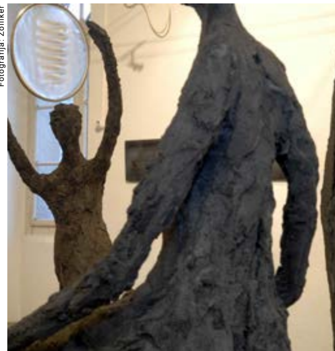
AR't Herisau: pobuda za umetniško razstavo, organizirano že desetič zapored, je bila podelitev naziva Alpsko mesto leta 2003.

Na jubilejni razstavi «Potovanje skozi čas» novembra 2012 se je javnosti predstavilo dvajset umetnikov in umetnic, vsak z dvema prispevkoma: z delom, ki je nastalo v letu ustanovitve društva AR't Herisau, in izbranim aktualnim delom. Gre za povezave in večplastnost nekega potovanja skozi čas, obenem pa tudi za omejenost ustaljenih navad in razhajanje z njimi.