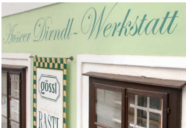
Modernité et tradition font bon ménage à Bad Aussee.

Située en Styrie, au cœur géographique de l'Autriche, à une altitude de 659 m, la station thermale de Bad Aussee est marquée historiquement par l'exploitation des salines et par sa situation relativement isolée au cœur d'une région montagneuse. Elle est perçue en Autriche comme une petite région avec une forte identité culturelle.