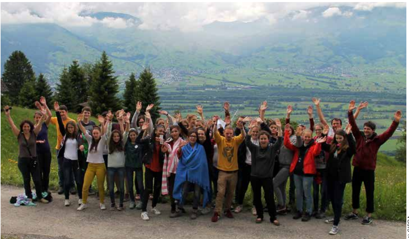
Der Verein Alpenstadt des Jahres und seine Mitglieder beschäftigen sich gleich in mehreren Projekten mit echter Beteiligung junger Menschen in den Alpen. Dass dieses Engagement bereits Früchte trägt, zeigen gelungene Beispiele aus den Partnerstädten.