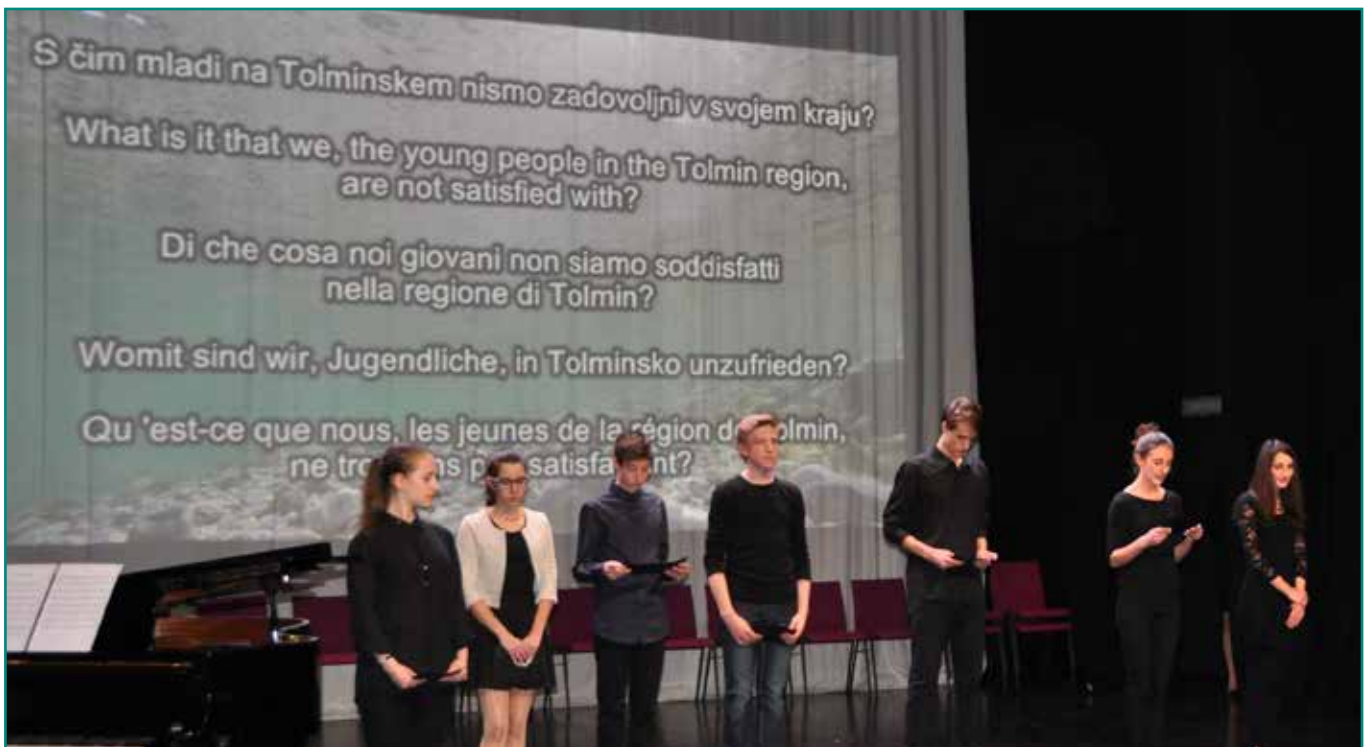
Jungen Menschen Raum zu geben und sie einzubeziehen ist für Tolmin ein Kernanliegen, auch über das Jahr als „Alpenstadt des Jahres 2016“ hinaus. Den Rahmen dafür bietet ein Jugendprogramm, dass Verantwortliche und Jugendliche gemeinsam entwickelt haben.

Ich denke bei der Jugend, weil wir im letzten Jahr ein lokales Jugendprogramm entwickelt haben, das in einigen Monaten fertig werden und dem Stadtrat präsentiert werden soll. Sehr wahrscheinlich wird es beschlossen. Mit dem Thema Jugend haben wir an der Eröffnungsfeier begonnen: Die Jugendlichen haben uns klare Botschaften überbracht, was wir für sie tun sollten. Wir haben ihnen zugehört und haben mit ihnen gemeinsam das Jugendprogramm entwickelt. Ich finde, das ist ein grosser Schritt vorwärts für die lokale Jugend.