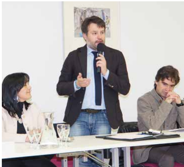
Francesco Brollo, Bürgermeister der Alpenstadt 2017 will der Region Karnien mit dem Beitritt zum Verein und einem reichen Jahresprogramm eine nachhaltige Zukunftsperspektive geben.

Stadt, die alpine Kultur durch die Einbindung von jungen Menschen in das Jugendparlament zu erhalten und weiterzuentwickeln ist ebenfalls eine wichtige Initiative für die Zukunft. Schliesslich bestätigt das Engagement von Tolmezzo für eine aktive grenzüberschreitende Zusammenarbeit mit anderen Städten und ländlichen Gemeinden der Alpen, dass die Stadt ihren Platz im Verein „Alpenstadt des Jahres“ verdient hat.