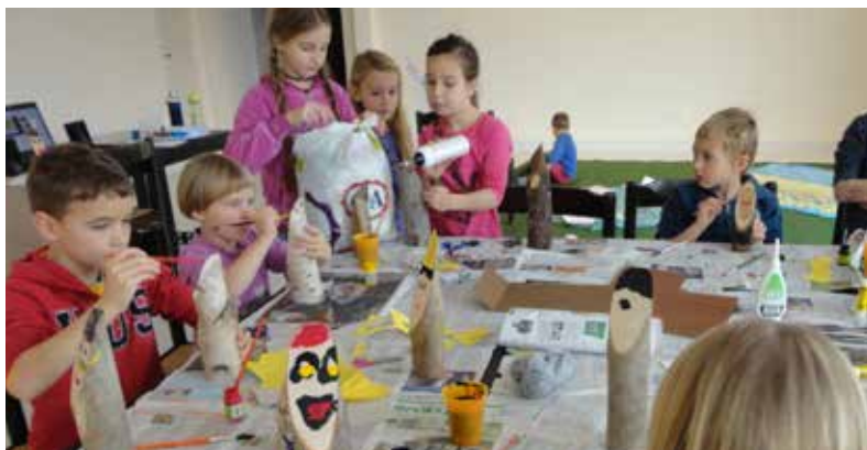
In fast allen Alpenstädten fanden anlässlich der Initiative der Alpenkonvention „Berge lesen“ Vorträge, Lesungen oder Bastelnachmittage wie hier in Tolmin, statt.